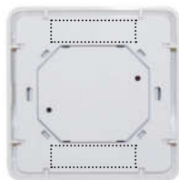
Obr.2 Umístění samolepících pásků