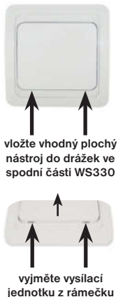
Obr.4 Demontáž vysílací jednotky